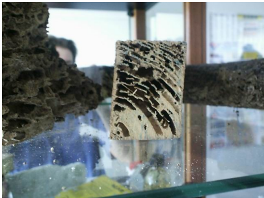
Dégâts dans le bois