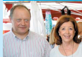
Marie-Josée ROIG Député-Maire d'Avignon Ancien Ministre

La Fête des Foins témoigne par ailleurs du dynamisme des associations locales. Elles ont œuvré à l'élaboration d'un programme qui propose une diversité d'animations permettant au public le plus large de prendre part à cet événement dans une ambiance des plus conviviales, à l'image de l'accueil des habitants de Montfavet.