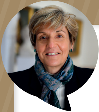
Cécile Helle, Maire d'Avignon

Avignon s'apprête à accueillir à nouveau la manifestation Le Printemps des Poètes : après des thèmes fédérateurs tels que la beauté, le courage, le désir et l'éphémère, cette 25 e édition met à l'honneur les Frontières, en invitant l'artiste international JR à illustrer son affiche. Un thème en résonance avec Avignon, ville sans frontière, qui rayonne grâce à son festival et son patrimoine dans le monde entier. Les frontières... comme une invitation à questionner, accueillir, se rassembler et tendre la main à l'inconnu.