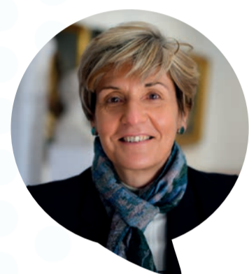
Cécile Helle Maire d'Avignon

Accueillir de nouveaux conseillers de quartier est pour moi une grande satisfaction.