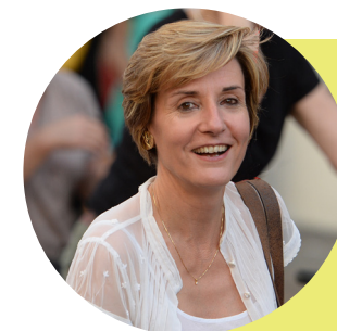
Cécile Helle, Maire d'Avignon