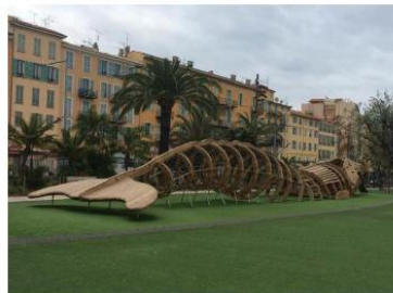
Promenade du Paillon, Nice.