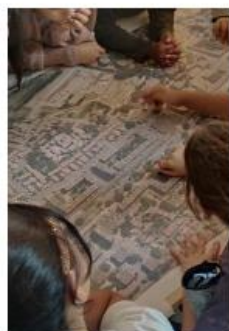
Concorde - Dalka