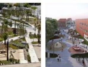
Ville d'Avignon - Rénovation Urbaine des Olivades