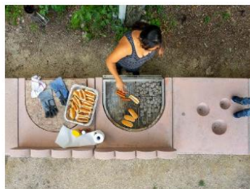
Studio Ossidiana - The garden table, Chicago