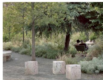
SINAE - Skanderberg square, Tirana