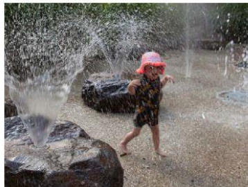
Kyneton botanic gardens, Australie