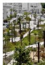
AVIGNON Vie d'école