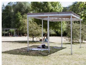
Peaks - Lac des Sapins, Cublize