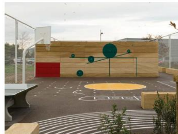
Concorde, Marseille Plan d'Aou