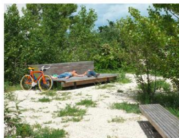
BASE - Parc Blandan, Lyon