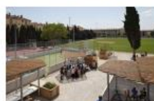
Concorde - Dalka