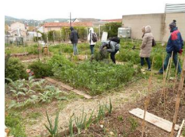
Jardins familiaux, Marseille, Plan d'Aou