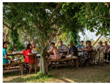
Extrait du film La main de Dieu