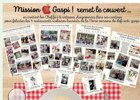
11 e semaine de défi anti-gaspi dans les cantines