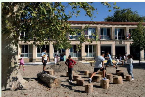
Une nouvelle Fraîch'Cour école de la Trillade