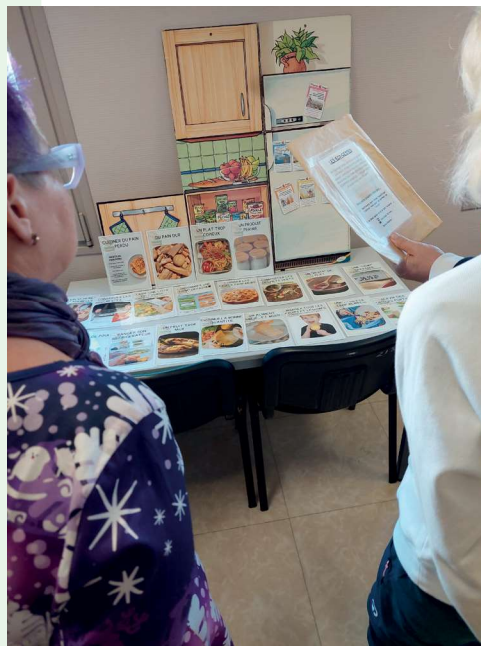
Plan alimentation locale : agents municipaux en formation le 04/10/2024