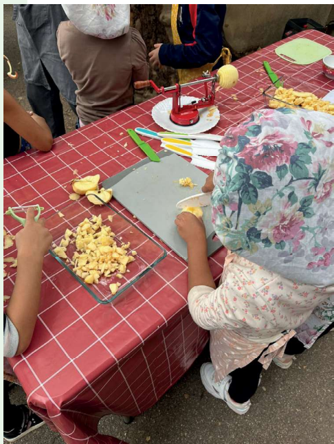
Plan alimentation locale : animation cuisine de rue par Les jardins du colibri 05/10/2024 fête de quartier Nord-rocade