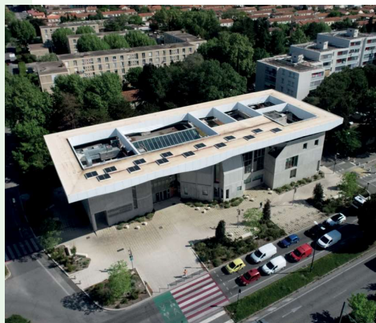
Panneaux solaires sur la toiture de la Bibliothèque Renaud-Barrault