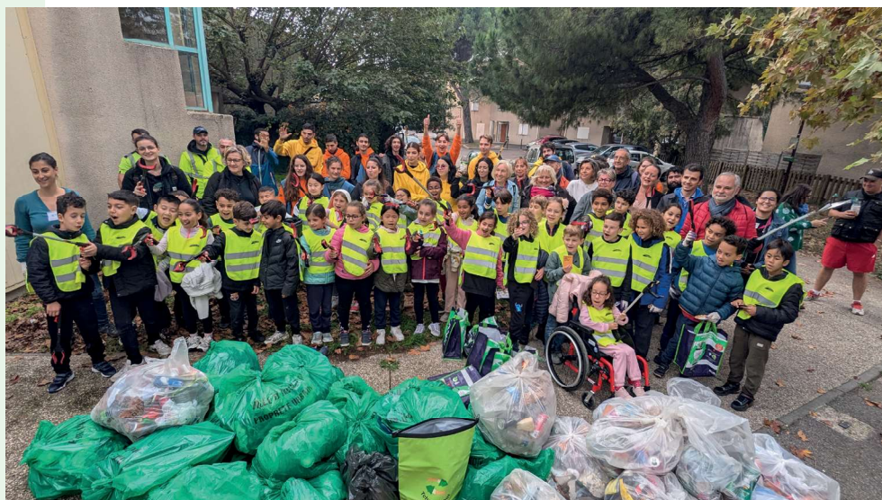
Ramassage déchets et mégots Mairie Est au Pont-des-deux-eaux 06/11/24