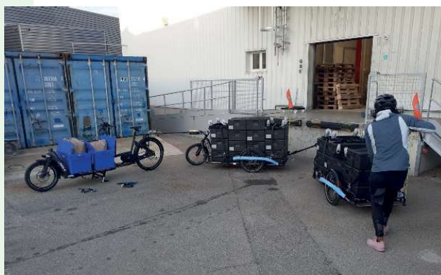
« La Roue Tourne » livre les cantines à vélo-cargo depuis 04/2024