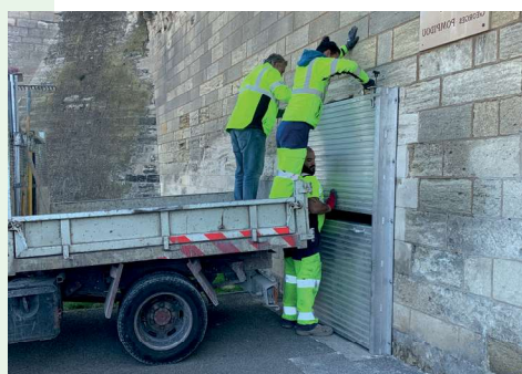
Montage des batardeaux par les agents municipaux pour protéger contre le risque inondation