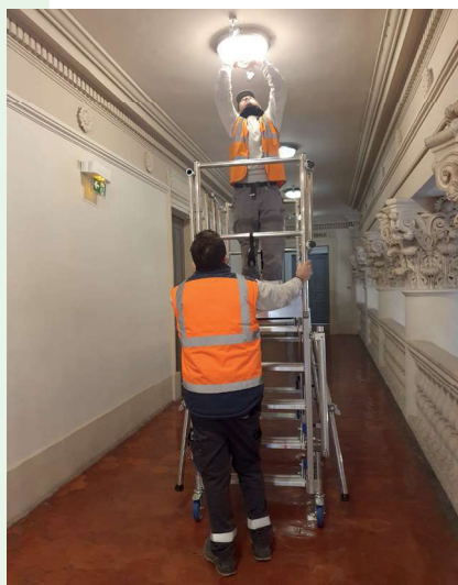
Remplacement ampoules par Leds à l'hôtel de ville le 10/04/2024

marchés publics avec application loi relative à la lutte contre le gaspillage et à l'économie circulaire soit 11 % des marchés annuels