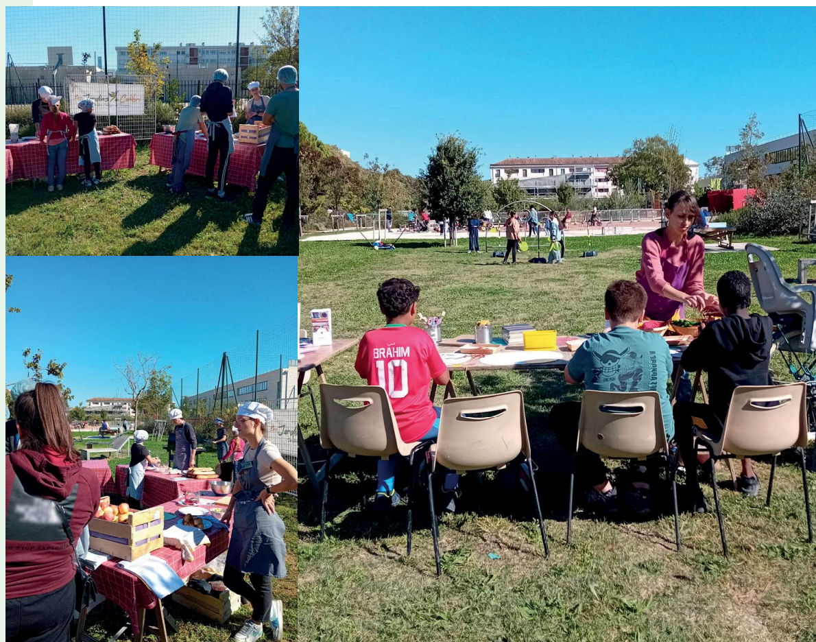
Fête de quartier Nord rocade, village du développement durable 05/10/2024