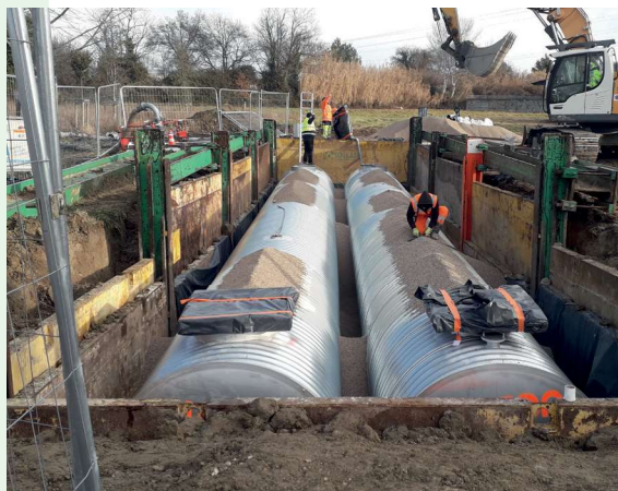
Cuve enterrée de récupération d'eau de pluie de la « forêt enchantée »