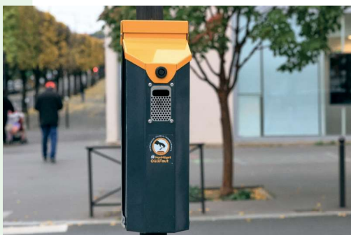
Cendrier de rue