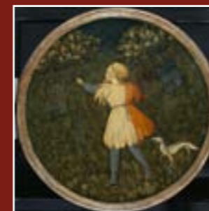
Maitre du Jugement de Paris du Bargello, Jeune chasseur au faucon, musée du Petit Palais - Louvre Avignon

Par courriel : reservation.petitpalais@ mairie-avignon.com