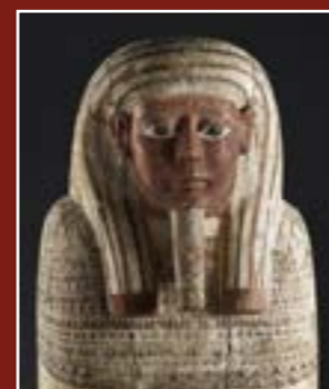
Sarcophage masculin d'un prêtre d'Amon Ré, Musée lapidaire