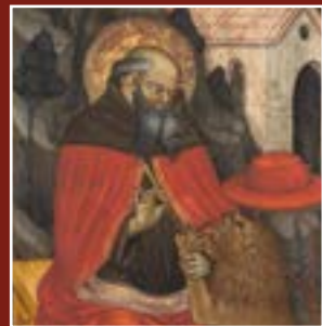
Ottaviano Nelli, Saint Jérôme guérissant le lion, musée du Petit Palais – Louvre Avignon