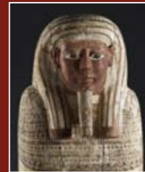
Sarcophage masculin d'un prêtre d'Amon Rê, Musée lapidaire