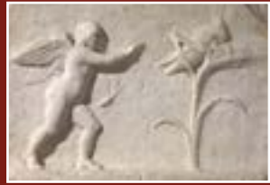
Eros pourchassant une sauterelle, musée Calvet