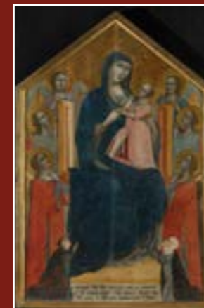
Peintre anonyme dit Maître de 1310, Vierge en majesté avec les donateurs Paci, musée du Petit Palais - Louvre Avignon