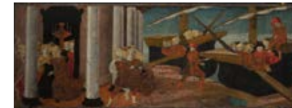
Libérale da Verona, L'enlèvement d'Hélène, musée du Petit Palais - Louvre Avignon

Par courriel : reservation.petitpalais@mairie-avignon.com