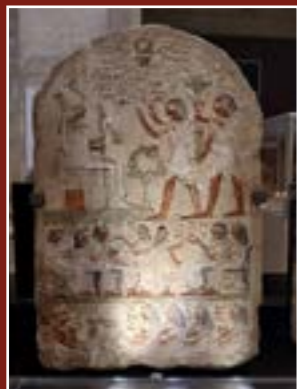
Stèle funéraire de Nefer-Nen, Musée lapidaire