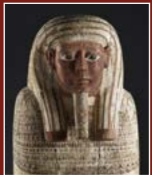
Sarcophage masculin d'un prêtre d'Amon Rê, Musée lapidaire