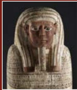
Sarcophage masculin d'un prêtre d'Amon Rê, Musée lapidaire