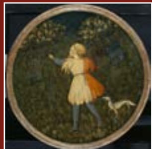
Maitre du Jugement de Paris du Bargello, Jeune chasseur au faucon, musée du Petit Palais - Louvre Avignon