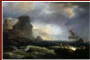
Joseph Vernet, Marine, tempête, musée Calvet