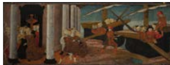
Liberale da Verona, L'enlèvement d'Hélène, musée du Petit Palais – Louvre Avignon

Amours impossibles, trahisons, exploits... Ces coffres de mariage de la Renaissance racontent des histoires incroyables et tragiques. Venez décoder les images et découvrir les secrets cachés derrière chaque scène !