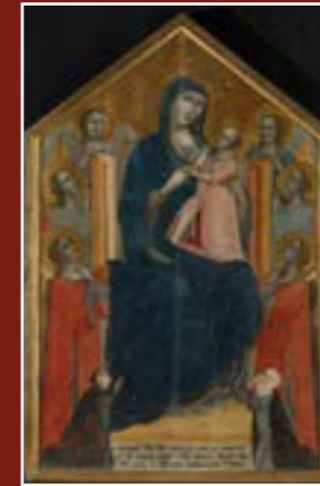
Peintre anonyme dit Maître de 1310, Vierge en majesté avec les donateurs Paci, musée du Petit Palais - Louvre Avignon