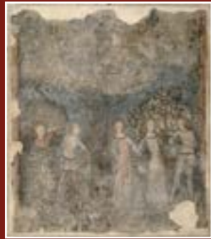
Anonyme provençal, Scène courtoise - La Carole, musée du Petit Palais - Louvre Avignon