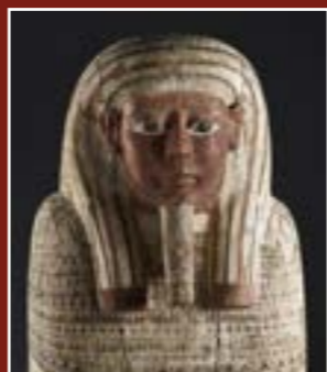
Sarcophage masculin d'un prêtre d'Ammon Rê, Musée lapidaire